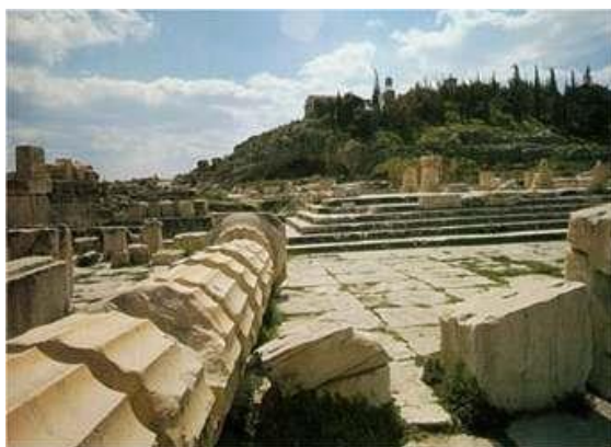
A fő beavató csarnok (Telesterion) Eleusis-ban.

A görögöknél a kisebb misztériumokat tavasszal végezték Agrai-ban, Athén közelében, míg a nagyobb misztériumokat ősszel ünnepelték Eleusis-ban. A kisebb misztériumokban a jelölteket, akik részt vettek az első szertartásokban, mystai -nak hívták (a becsukott szemű és szájú), míg a nagyobb misztériumok során a mystai epoptai -vá (a tisztánlátó) vált, és szoros összeköttetésbe került a magasabb Én-jével (MS 32).