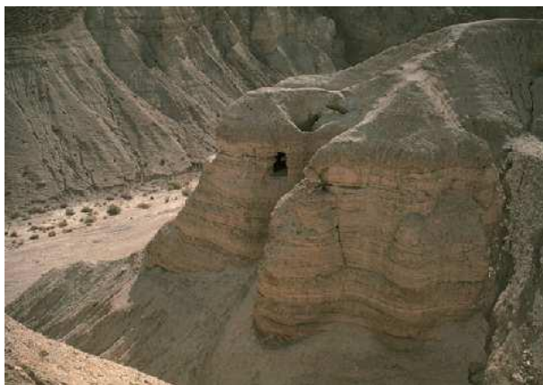
A 4. Qumran barlang

A jelentős orientalista, Max Müller jegyezte meg 1860-ban, hogy az elmúlt 50 évben „a világ legfontosabb vallásainak hiteles dokumentumai kerültek elő a legváratlanabb, szinte csodálatos módon”. Például a buddhizmus kanonizált könyveire, Zoroaszter Zend-Avesta -jára és a Rig Véda himnuszaira utalt. Blavatsky hozzáteszi: