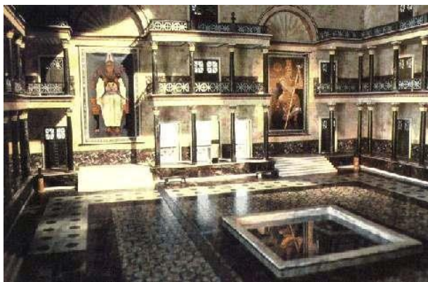
Az Alexandriai Múzeum fő csarnokának rekonstrukciója.

Az alexandriai könyvtár volt az ókori világ leghíresebb könyvtára. Az Alexandriai Múzeumként (vagy a Múzsák templomaként) ismert kutatási intézmény részét képezte. A könyvtárat és a múzeumot a Ptolemaioszok hosszú sora alapította és működtette az i.e. III. század kezdetétől fogva. Alapítottak egy kiegészítő könyvtárat is i.e. 235 körül Serapeumban, egy Serapis istennek szentelt templomban. Az alexandriai könyvtár módszeresen összegyűjtötte az ókori világ tudását, és úgy becsülik, hogy működésének csúcán 400-700,000 tekerccsel és papirusszal rendelkezett.